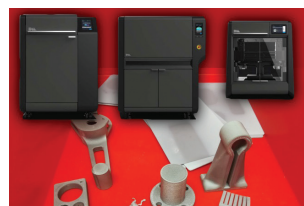
> Une chaîne de production de Fabrication additive