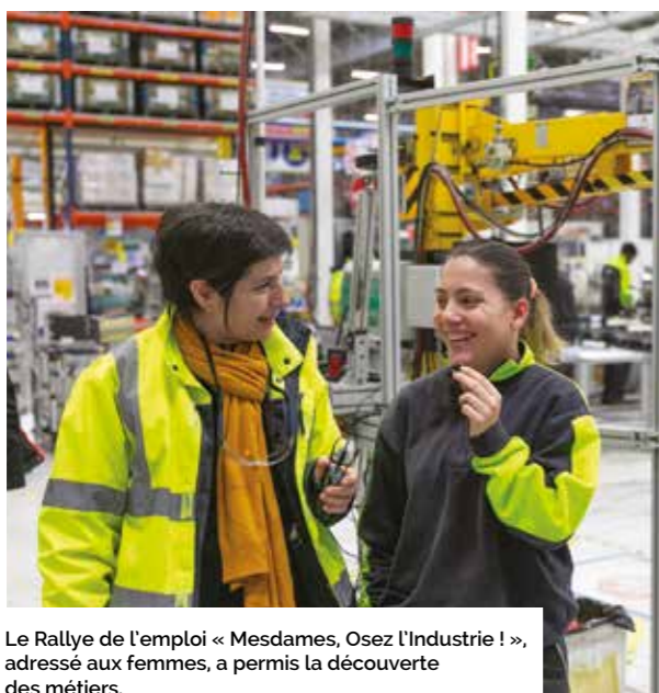
Le Rallye de l'emploi « Mesdames, Osez l'Industrie ! », adressé aux femmes, a permis la découverte des métiers.

Les entreprises industrielles sont face à un défi de taille : attirer et recruter dans un contexte de transition technologique et environnementale où les projets d'embauches se multiplient.