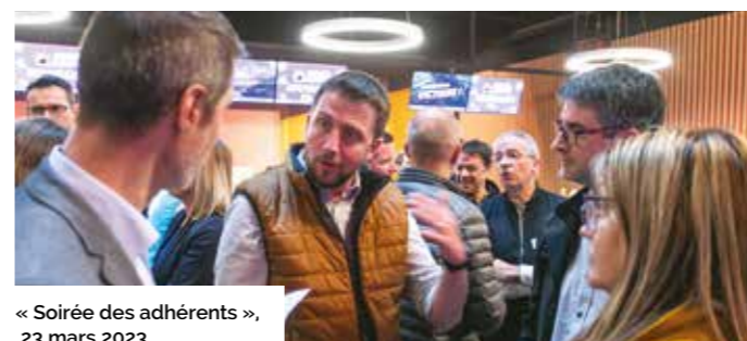
« Soirée des adhérents », 23 mars 2023.

Une délégation de dirigeants aininois a répondu à l'invitation de l'UIMM le 9 mars 2022 à la Maison de la Mutualité, à Paris. Ils ont rejoint près d'un millier d'industriels à l'occasion de « #France 2027 » organisé pour la première fois par la branche dans le cadre du débat présidentiel. Ce temps fort de la vie politique a permis aux chefs d'entreprises de questionner les candidats à l'élection présidentielle sur leurs projets pour l'industrie et de témoigner du dynamisme du territoire. Le rendez-vous se voulait également un moment privilégié entre industriels, prolongé par des échanges informels, dans le contexte exceptionnel de la campagne présidentielle.