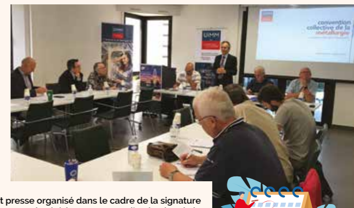
Point presse organisé dans le cadre de la signature de l'avenant de révision portant sur l'extinction de la convention collective des salariés non-cadres

Accompagner la mise en conformité La refonte du dispositif dessine un cadre social plus sécurisé juridiquement, ajusté à la réalité opérationnelle des entreprises. Aligné sur les évolutions du travail et adapté aux enjeux de l'industrie, il repose sur un socle commun, visible et protecteur. Rappelons que la nouvelle convention collective redéfinit les composantes de la vie du salarié (temps et conditions de travail, protection sociale, santé, rémunération, reconnaissance des compétences, emploi et formation). Ce corpus de dispositions a fait l'objet de réunions collectives régulières, de sessions d'information et d'ateliers thématiques tout au long de l'année pour mieux vous guider dans les différentes étapes. Parmi elles, la mise en conformité des entre-